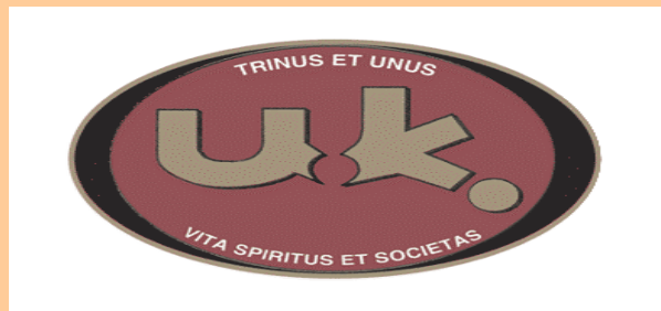
Universidad Argentina John F. Kennedy