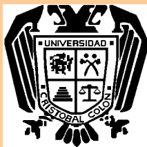
Universidad Cristóbal Colón